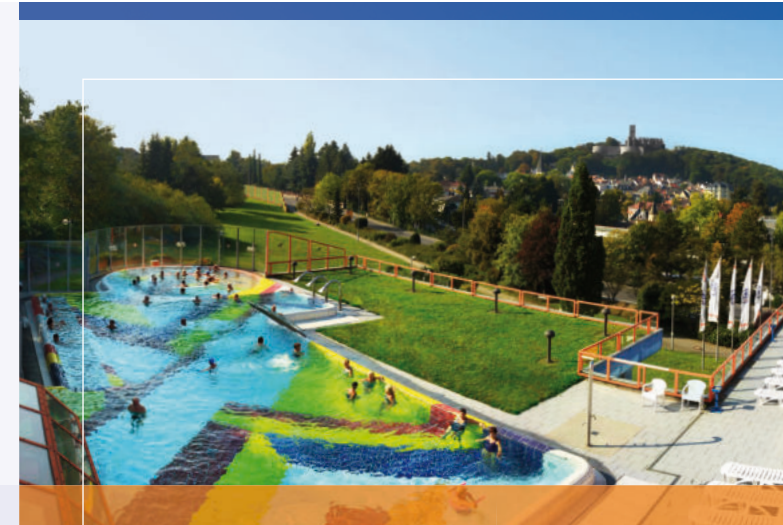
Eintauchen und Entspannen im Kurbad Königstein

– Änderungen vorbehalten – Stand: 04/2022_2