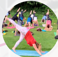
Yoga für Kinder im Klinik-Garten