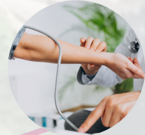
Diagnose- Parcours an den Ständen