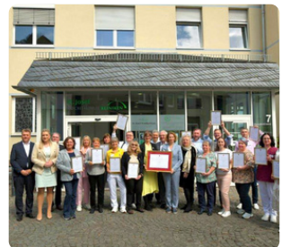
Überreichung des Zertifikats „Silviahemmet“

Ziel ist es, insbesondere dem älteren erkrankten Menschen wieder ein hohes Maß an Mobilität und Selbstständigkeit zu ermöglichen, Einschränkungen im alltäglichen Leben zu erkennen, zu benennen und an deren Verbesserung zu arbeiten bzw. Hilfe anzubieten.